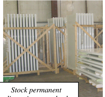
Stock permanent dimensions standard